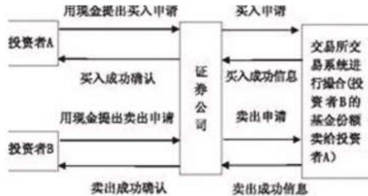
图 4-1 ETF 二级市场交易示意图